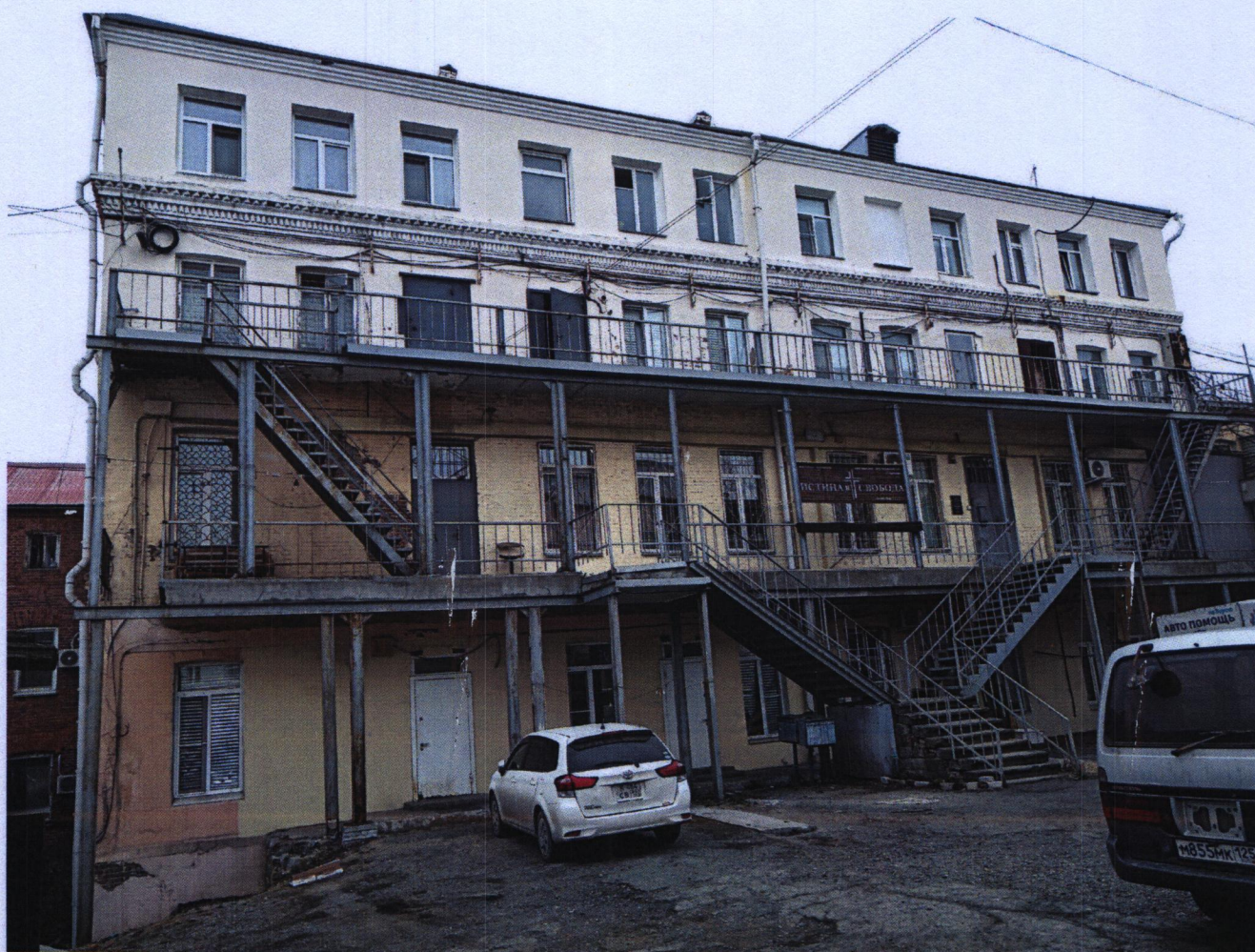
Главный (южный) фасад

Материал и характер отделки фасадных поверхностей - кирпич под обмазку и покраску. Элементы архитектурной отделки фасада образованы выпусками кирпича.