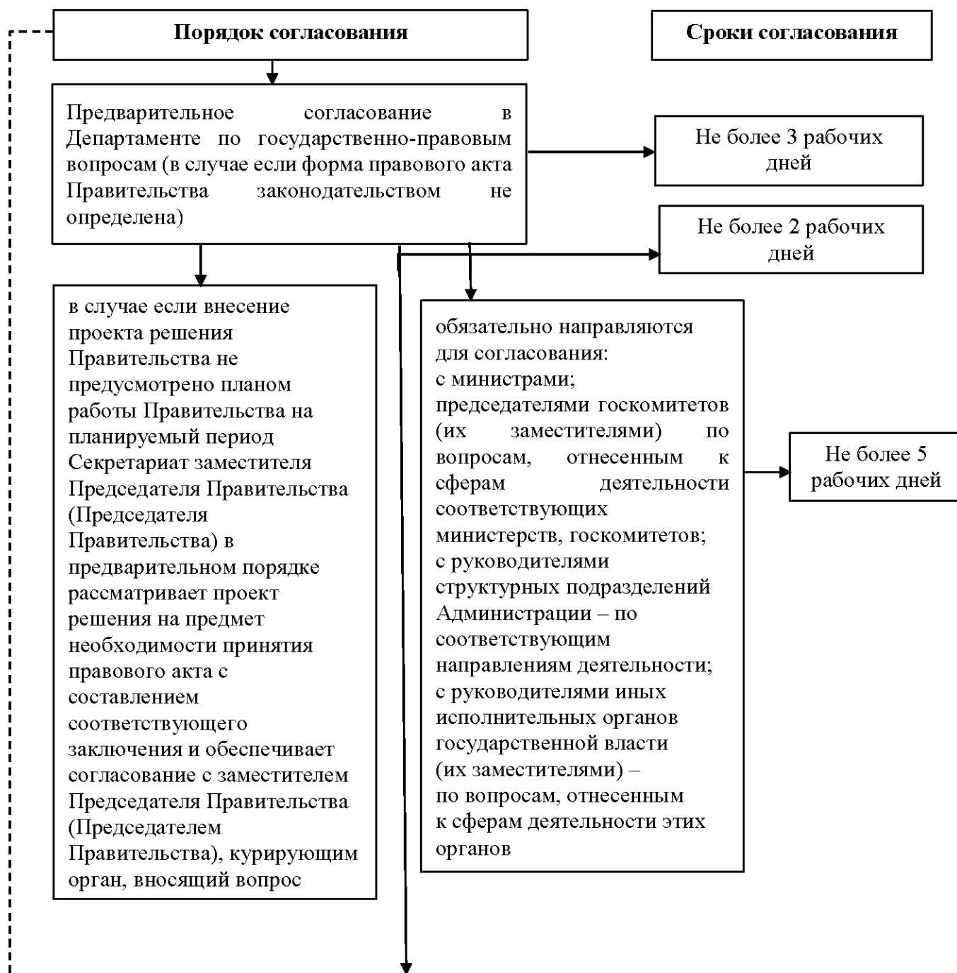
СХЕМА согласования проектов решений Правительства Республики Саха (Якутия)

к постановлению Правительства Республики Саха (Якутия) от 30 декабря 2022 г. № 843