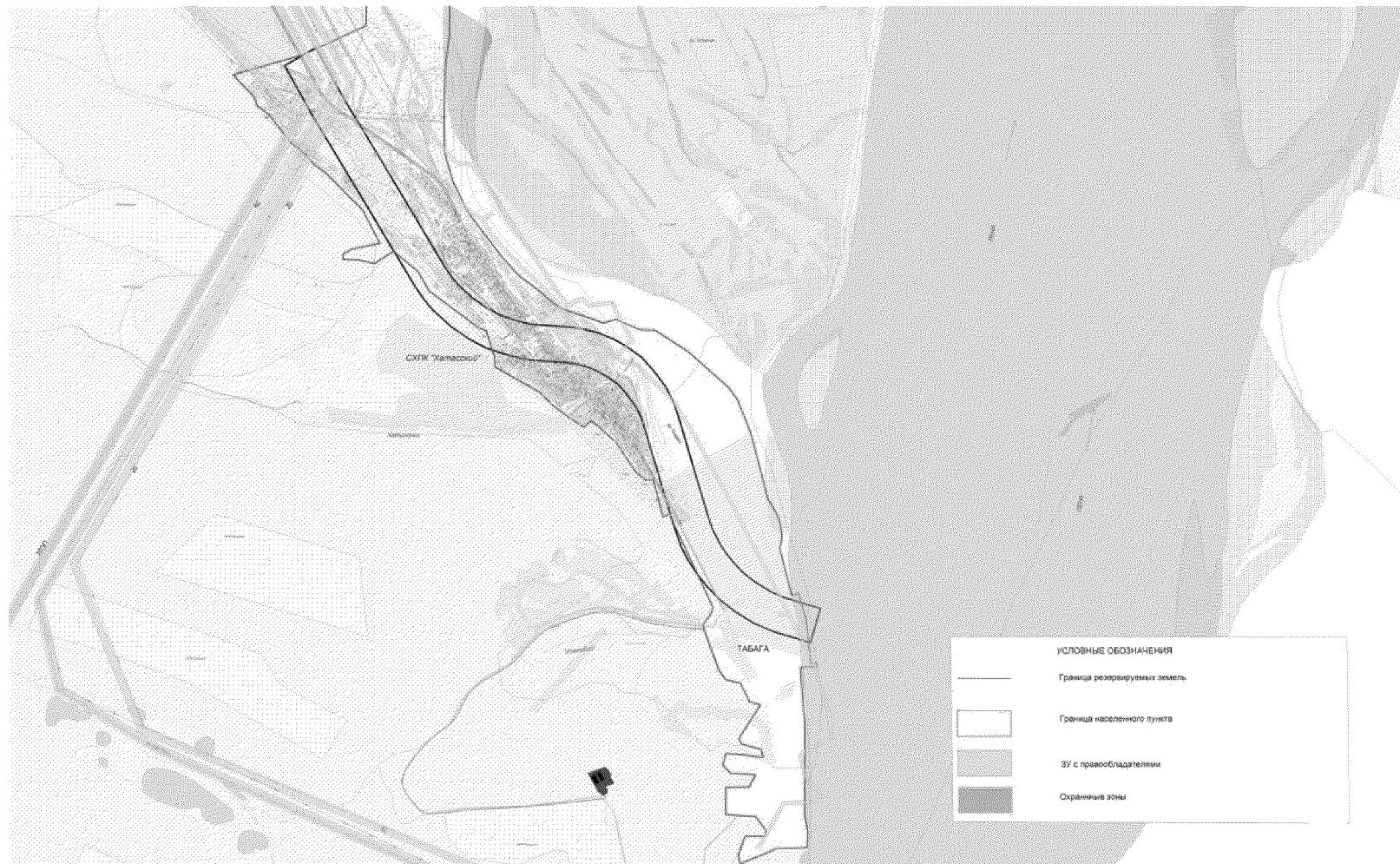
СХЕМА ЗЕМЕЛЬ, расположенных на территории городского округа «город Якутск» Республики Саха (Якутия), резервируемых для государственных нужд Республики Саха (Якутия) в целях строительства мостового перехода через реку Лена

распоряжению Правительства Республики Саха (Якутия) от 01 марта 2019 г. № 209-р